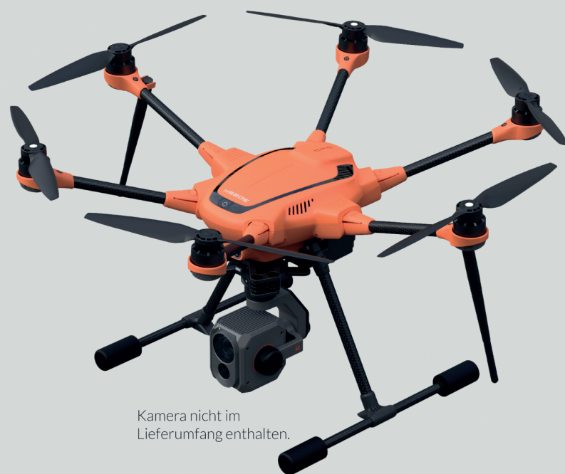
Kamera nicht im Lieferumfang enthalten.

ace-tec GmbH, Sandweg 5, D-25899 Niebüll T.: +49 (0) 4661-675060, F.: +49 (0) 4661-675061, E.: info@ace-tec.de, www.ace-tec.de